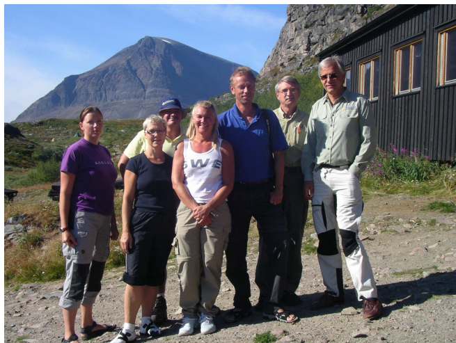
Svenskt Friluftslivs styrelse på Kebnekajse fjällstation i augusti 2006.

Styrelsen har sammanträtt sex gånger under 2006.