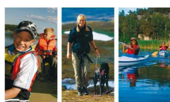
Friluftslivet och samhället Svenskt Friluftslivs friluftspolitiska program